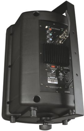
The C170P is shipped with a metal U-bracket for wall or ceiling mounting.