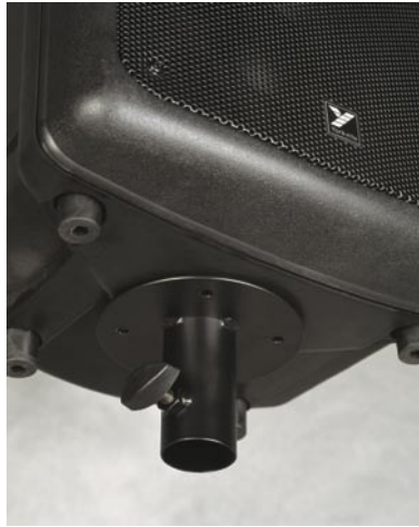
Un adaptateur optionnel pour montage sur pôle (C170ADAPT) est aussi disponible pour monter l'enceinte sur un pied à haut-parleur.